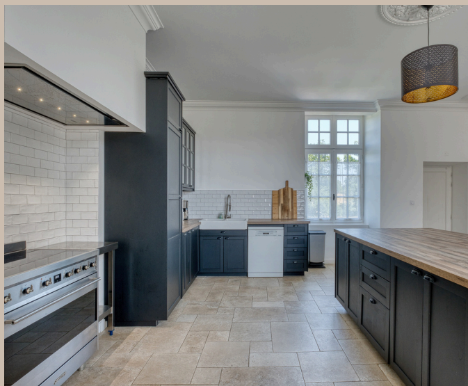
CUISINE DU MANOIR